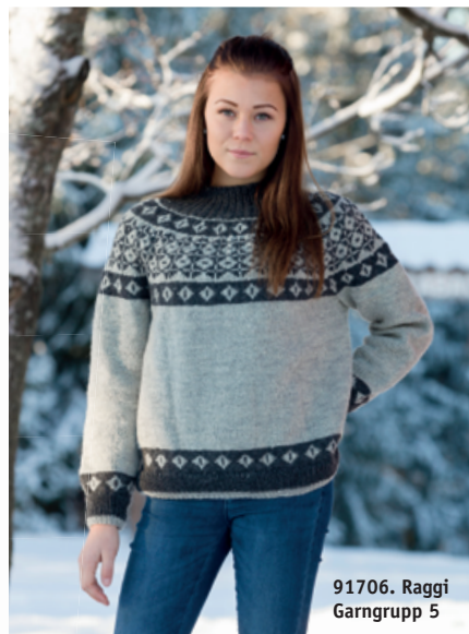
91706. Raggi Garngrupp 5