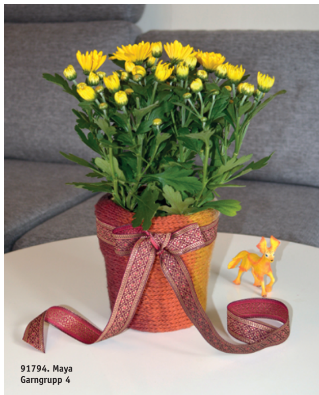
91794. Maya Garngrupp 4