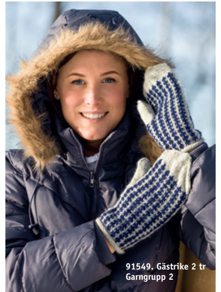
91549. Gästrike 2 tr Garngrupp 2