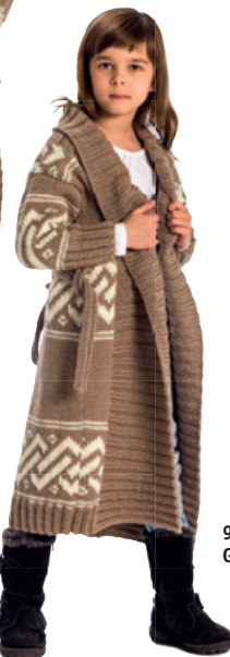
91727. Raggi Garngrupp 5