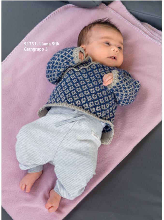
91731. Llama Silk Garngrupp 3