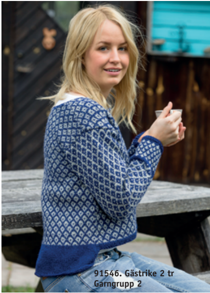
91546. Gästrike 2 tr Garngrupp 2