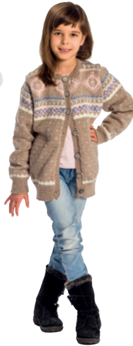
91678. Junior Garngrupp 3