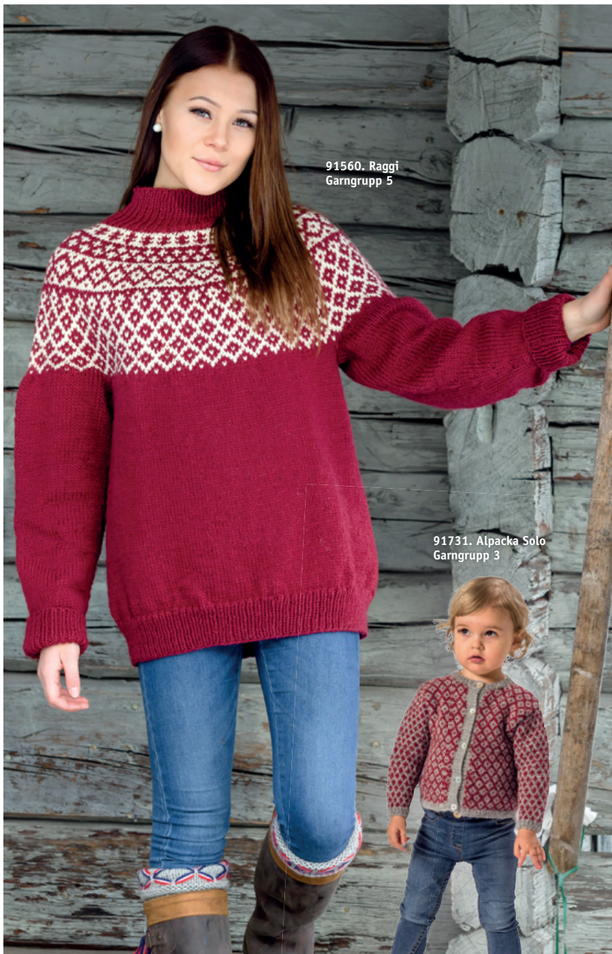
91731. Alpacka Solo Garngrupp 3