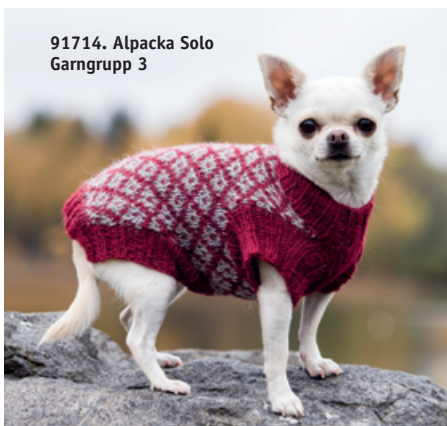
91714. Alpacka Solo Garngrupp 3