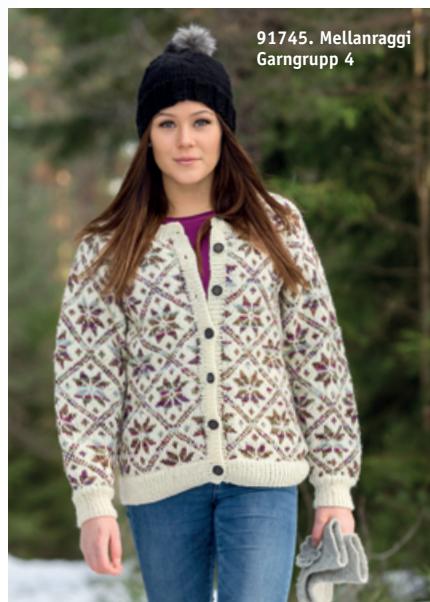
91745. Mellanraggi Garngrupp 4