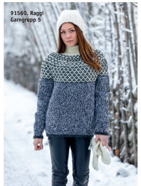
91560. Raggi Garngrupp 5