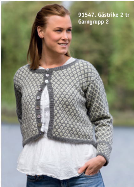
91547. Gästrike 2 tr Garngrupp 2