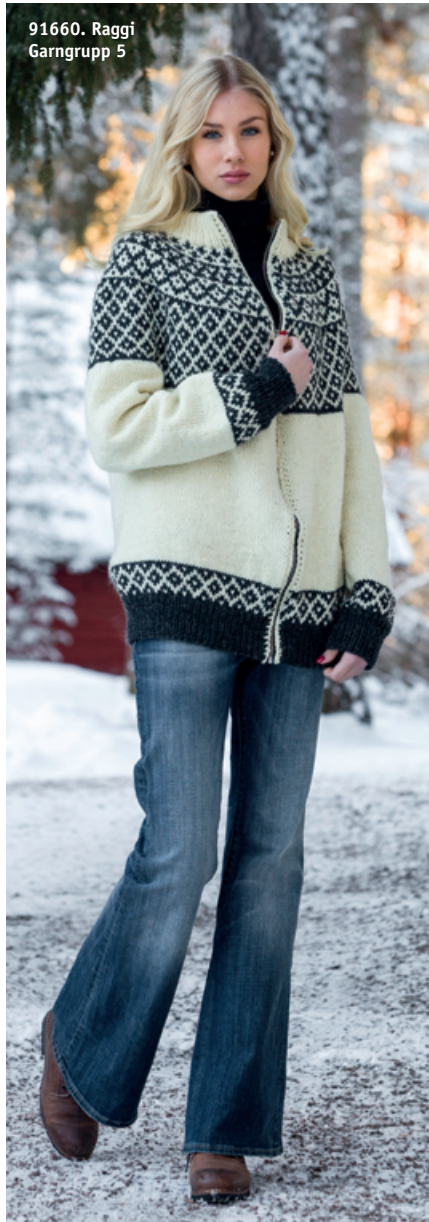
91660. Raggi Garngrupp 5