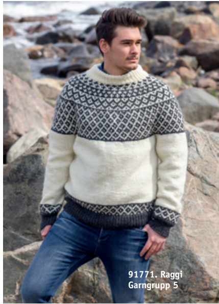
91771. Raggi Garngrupp 5