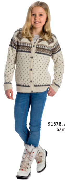
91678. Alpacka Solo Garngrupp 3