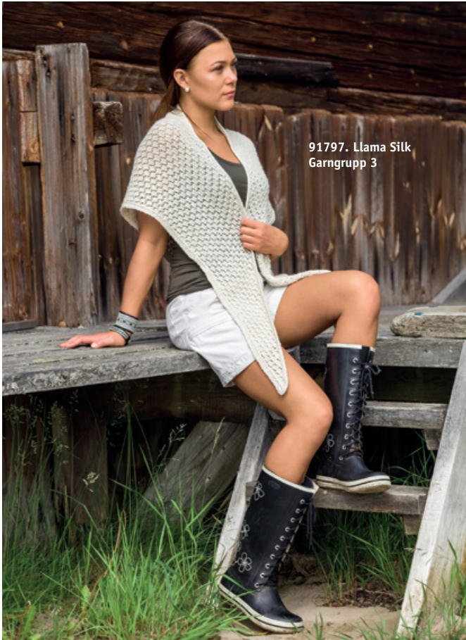
91797. Llama Silk Garngrupp 3