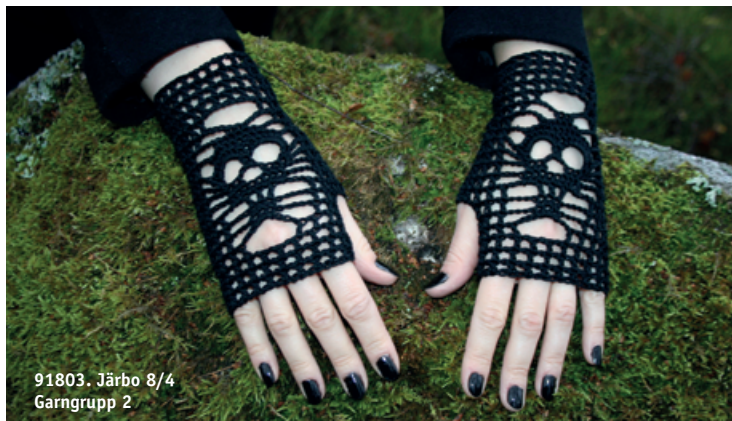
91803. Järbo 8/4 Garngrupp 2

Tänk att bara få krypa upp i soffan tillsammans med en varm kopp te, en skön filt och en stickning. I höst ser vi fram emot att sticka med säsongens nya garner och färger samtidigt som vi längtar efter att virka och pyssla till storhelger som t.ex. Halloween.