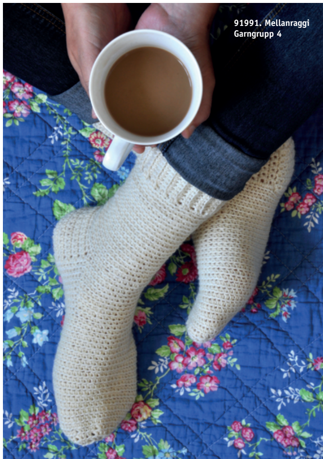
91991. Mellanraggi Garngrupp 4