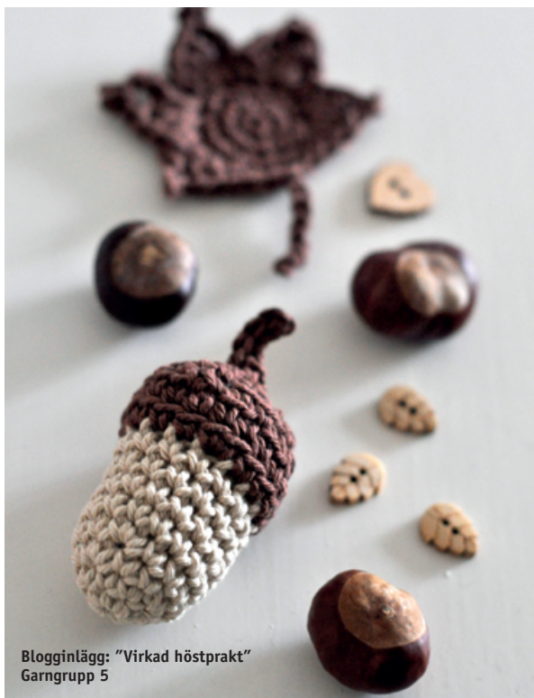
Blogginlägg: "Virkad höstprakt" Garngrupp 5

VILL DU LÄRA DIG ATT STICKA TUMVANTAR ska du prova vår tumvantskola, 91581, där vi förklarar steg för steg med både bild och text.