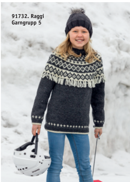
91732. Raggi Garngrupp 5