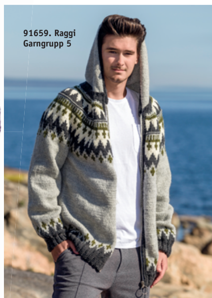
91659. Raggi Garngrupp 5