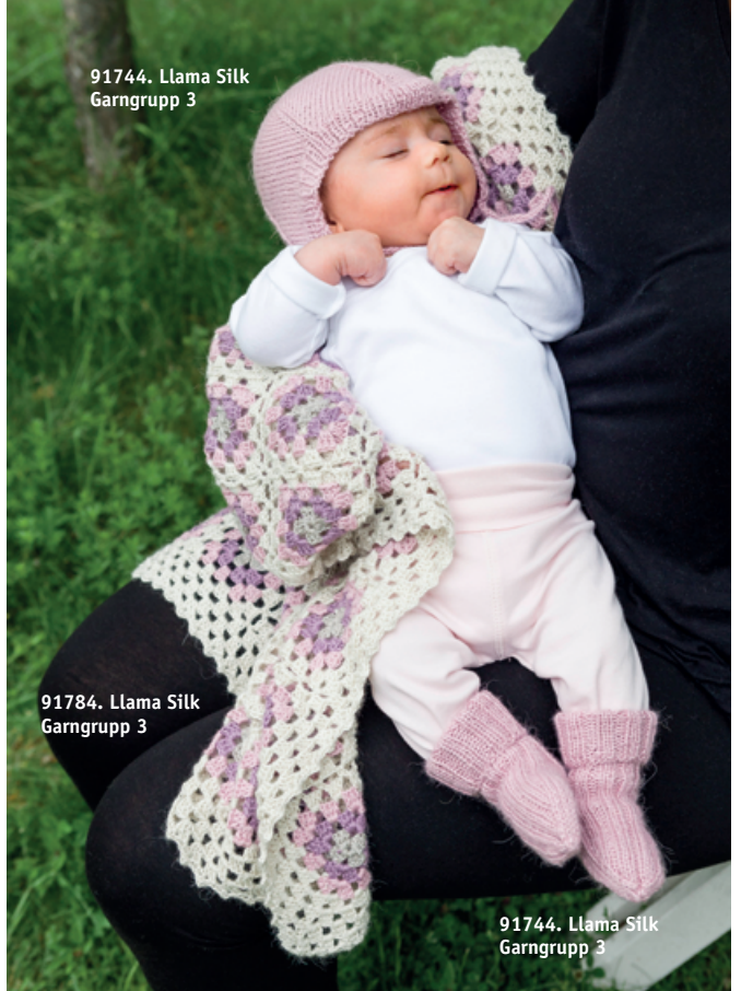
91744. Llama Silk Garngrupp 3