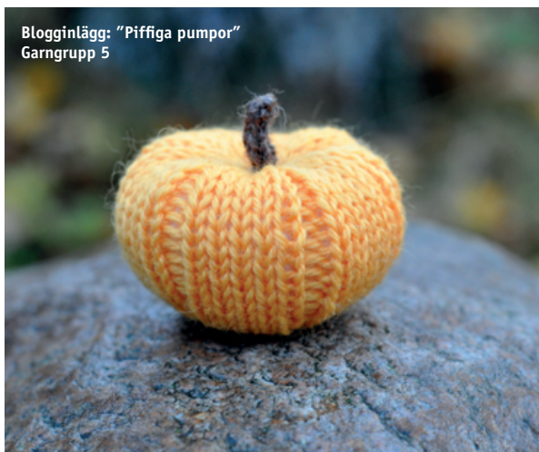
Blogginlägg: "Piffiga pumpor" Garngrupp 5