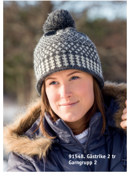
91548. Gästrike 2 tr Garngrupp 2