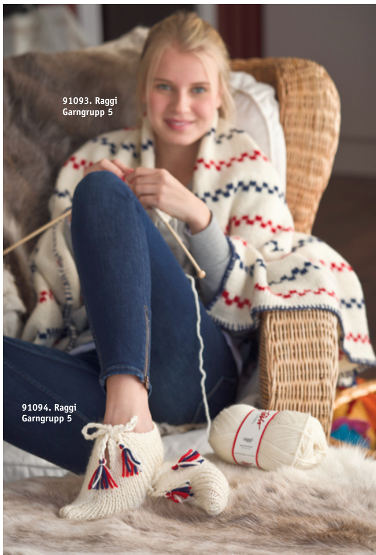
91093. Raggi Garngrupp 5