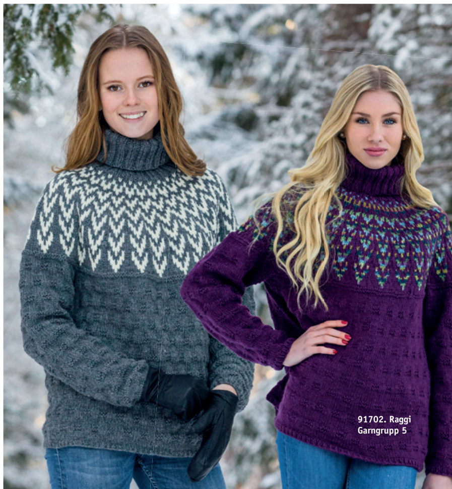
91702. Raggi Garngrupp 5