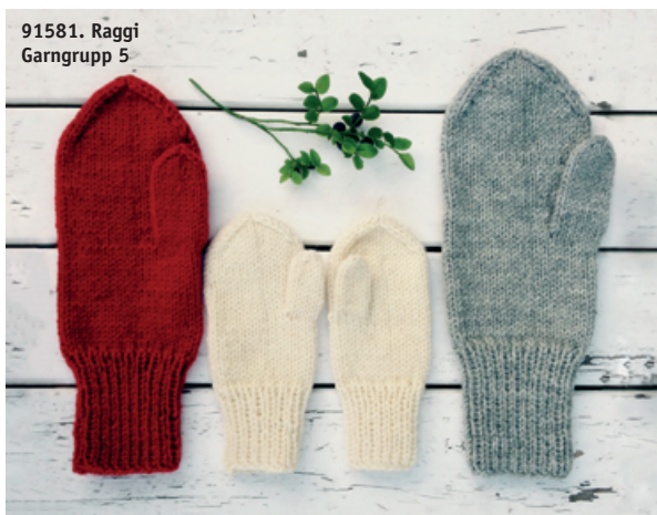
91581. Raggi Garngrupp 5

VILL DU LÄRA DIG ATT STICKA TUMVANTAR ska du prova vår tumvantskola, 91581, där vi förklarar steg för steg med både bild och text.