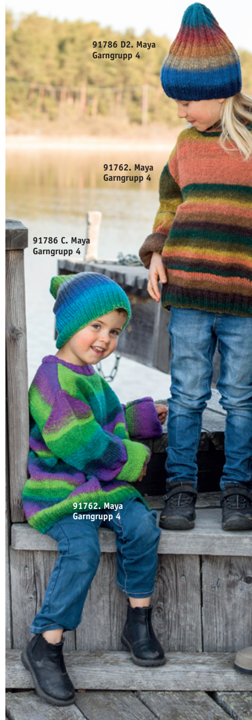
91786 D2. Maya Garngrupp 4

Med vårt nya ullgarn Maya stickar du värmande mössor för alla storlekar och smaker. Vilken modell väljer du?