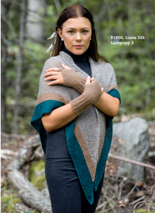
91900. Llama Silk Garngrupp 3